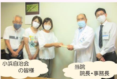
小浜自治会 の皆様

新型コロナウイルス感染症の流行に伴い、当院を応援して下さる企業や団体、個人などの多くの方々より、マスク等物資のご支援をいただきました。寄贈頂きました物資は大切に使用させていただきます。